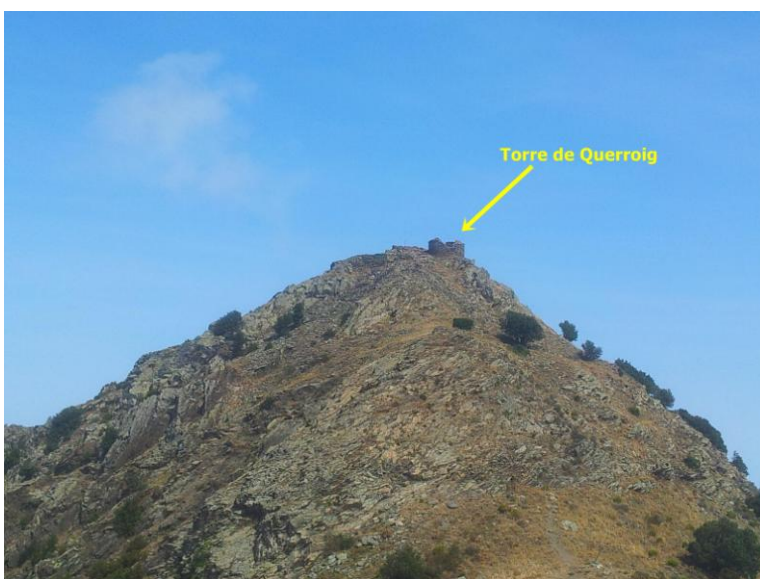
Pic i torre de Querroig (637 Mts.)

El puig sobre el qual es troben les restes del castell s'esmenta l'any 981 ( podium Cariorubio ) com a límit d'un alou del comte Gaufred d'Empúries. La història del castell, pròpiament, no es coneix gaire. Es troba documentat l'any 1385 ( castrum de Carroig ). Les ruïnes conservades semblen correspondre a una construcció dels segles X-XI. Quan el castell ja es trobava enrunat, es va construir, al mateix indret, la torre de Querroig, datable dels segles XIV-XV.